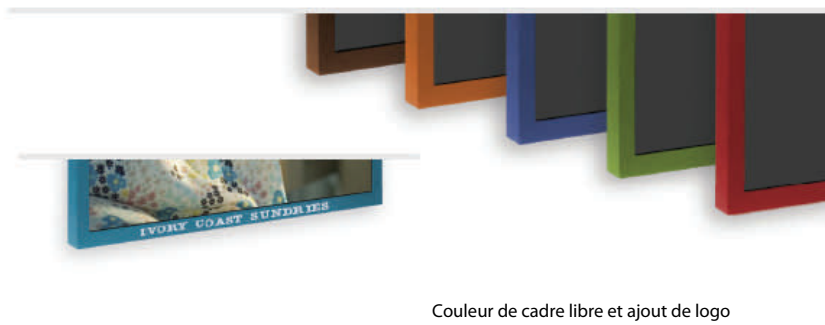
Couleur de cadre libre et ajout de logo

Le cadre sans logo de la série EP peut être peint à la couleur de votre choix et sérigraphié avec le logo de votre société ou de votre client. Ce programme Planar EP Select™ vous permet de créer l'écran unique répondant précisément aux besoins marketings et esthétiques de chaque salle.