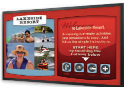
Tactilisation « dual touch »

La série EP propose, en option, une vitre tactile permettant d'interagir avec l'écran. Cette vitre est assemblée en usine et protège efficacement l'écran contre la poussière, l'humidité et la moisissure. La solution de Planar offre un « dual touch » précis