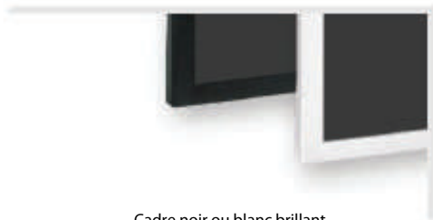
Cadre noir ou blanc brillant

Les moniteurs de la série EP sont disponibles en noir et en blanc brillant pour une intégration élégante dans votre environnement de travail. Par exemple, le blanc brillant peut être utilisé dans les environnements médicaux ou dans des espaces publics blancs pour que le public se concentre sur le contenu et pas sur le cadre.